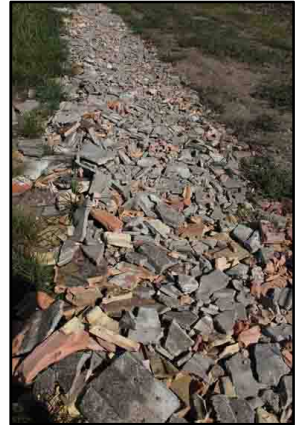
Bild bei dem vieles nicht zusammenpasst. Diese alten Gewohnheiten rasch zu verändern, wird kaum zu schaffen sein, denn von den Gemeindepolitikern wird dieses Thema derzeit ignoriert. Es liegt aber vor allem an ihnen, ihr Wegenetz regelmäßig zu kontrollieren und wilde Ablagerungen von Baumaterialien entfernen zu lassen, gleichzeitig aber auch über diese Problematik entsprechend zu informieren um die notwendige Gesinnung für eine saubere Umwelt zu schaffen.

Es ist eine verbreitete Unsitte, Bauschutt auf Agrarwegen zu deponieren, wie Beispiele aus Pötsching und Umgebung zeigen. Das Ziel ist klar – Entsorgung von „Bauabfall“ unter Umgehung von Deponiegebühren. Obwohl verboten, sind laufend Meter lange neue Ablagerungen festzustellen. Baustoffe enthalten Chemikalien, welche für das Grundwasser schädlich sind und so ungehindert in den Boden gelangen. Wie viele Fremdstoffe sonst noch eingebracht werden, ist kaum überschaubar. Darüber hinaus stellen diese Verfüllungen eine Verletzungsgefahr für Freizeitsportler – sowie Hunde und Wildtiere – dar, ganz abgesehen von der miserablen Optik. Wie soll sich ein sanfter Tourismus entwickeln können, wenn Gemeinden auf ihrem Wegenetz Müllhalden akzeptieren. Einerseits versucht die Landwirtschaft auf „Bio“ umzustellen und gleichzeitig wird neben den Feldern der Bauschutt deponiert. Ein